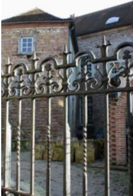
Grille au musée du bâtiment

Haut métier, parmi les aînés de l'humanité, la serrurerie a eu ses génies, ses célébrités, parfois ses martyrs.